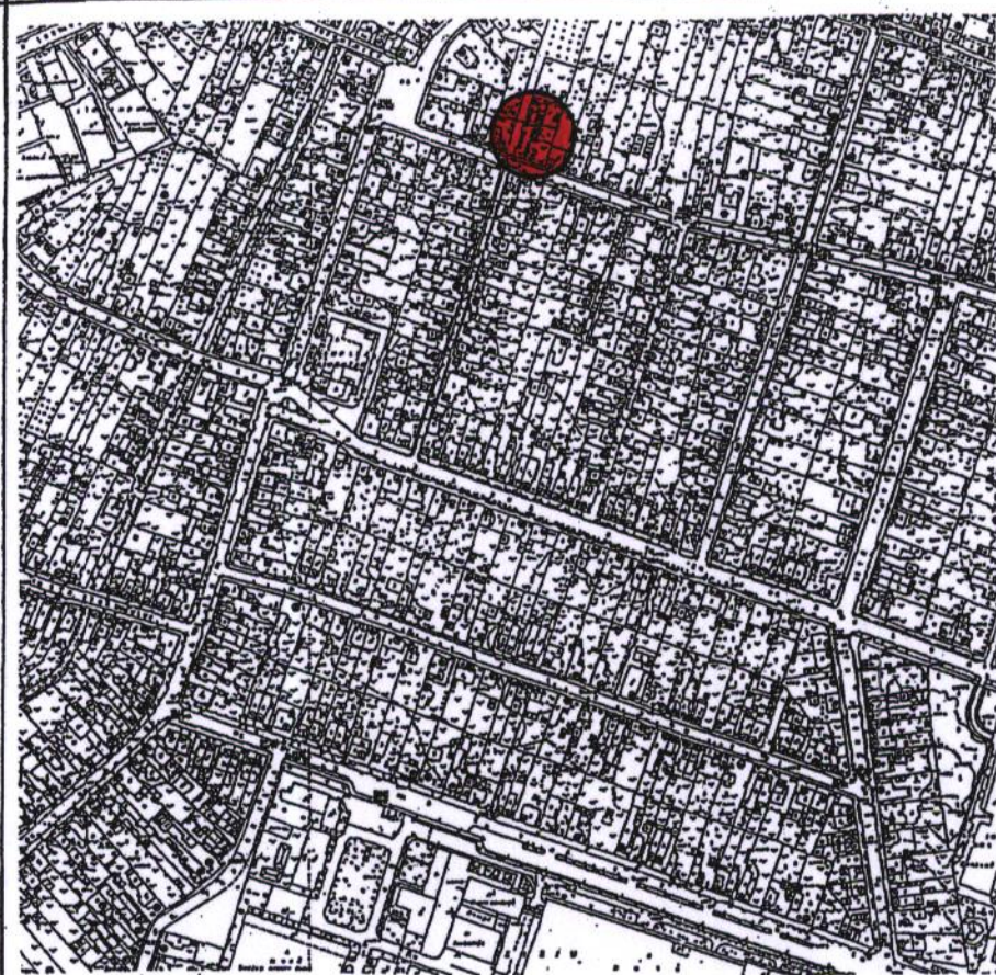
INCADRARE IN ZONA SC.1/5000